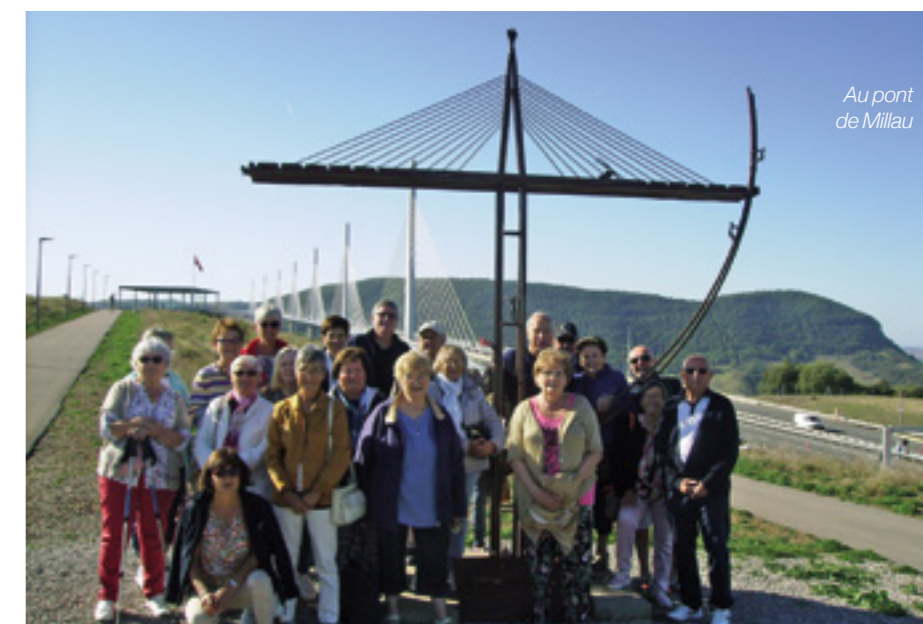
Au pont de Millau