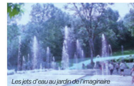
Les jets d'eau au jardin de l'imaginaire

Le jeudi 19 Mai : une sortie à Terrasson La Villedieu à réuni une quarantaine d'adhérents qui ont découvert le jardin imaginaire, le musée du chocolat Bovetti et le moulin de Maneyrol spécialisé dans la production d'huile de noix.