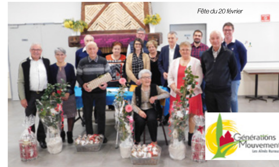
Fête du 20 février

Les élus du club des aînés de Seyches ainsi que les adhérents remercient les représentants de la commune de Peyrière et de Puymiclan pour le prêt de leur salle pendant les travaux de la salle de Seyches.