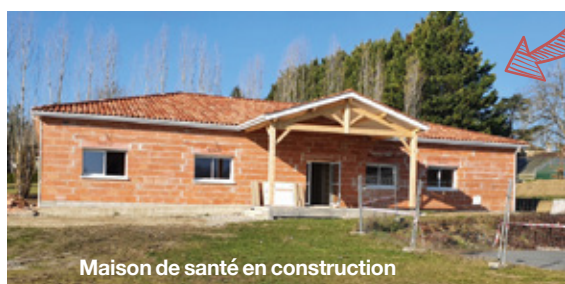
Maison de santé en construction